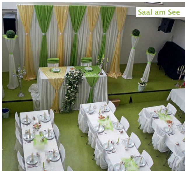
Saal am See